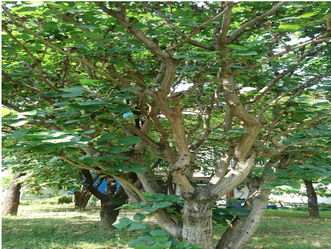
台灣刺苧-珍貴台灣原生樹種↓